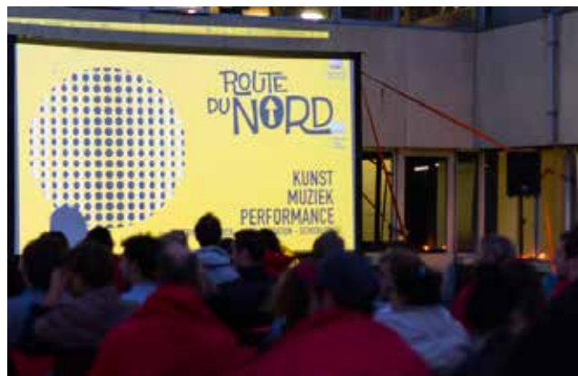
AFFR, lokale partner in 2013