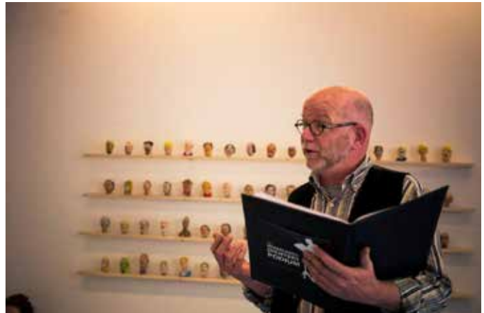
enkele foto's van verschillende optredens tijdens Route du Nord 2013