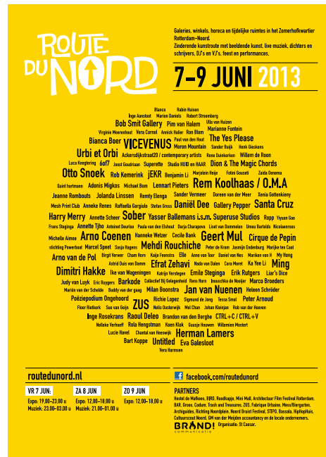
Flyer van Route du Nord 2013 A5 model