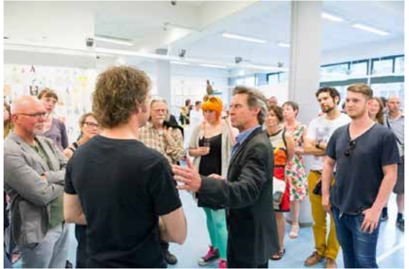
Foto: Anton Hoeksema van het CBK gaat in gesprek met de curator. Daarna leidt hij het publiek langs verschillende kunstwerken in de expositie. Bij de werken worden uitgelegd wat de achtergrond is van de werken en de kunstenaar (editie 2013).

Behalve interactieve kunst zijn er veel andere manieren om als bezoeker meer over kunst te leren. Daarvoor zoeken we in 2014 weer het contact met het CBK Rotterdam. Route du Nord wil niet alleen kunst laten zien, maar de bezoeker tevens meer achtergrond over kunst te verschaffen met als uiteindelijk (onderliggend) doel het bewust maken van de mogelijkheid de getoonde werken aan te kunnen schaffen.